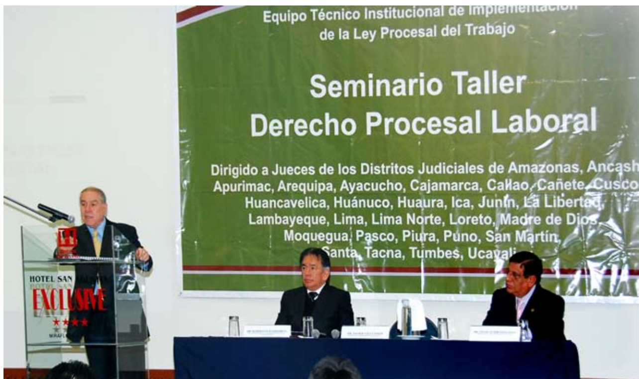
Presidente del Poder Judicial, Javier Villa Stein inauguró Taller de Derecho Procesal Laboral

Una exhortación a todos los magistrados del Perú, para que cambien su cultura procesal, para dar una más rápida solución a los conflictos que tienen a su cargo, formuló el Presidente del Poder Judicial, doctor Javier Villa Stein, el 8 de setiembre último.