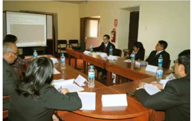
Reunión de la Comisión de Implementación evaluó la producción

A menos de un año de su aplicación en Moquegua, hasta marzo del 2010 un 98.8 por ciento de los casos se ha resuelto con procesados en libertad y solo 1.2 por ciento son imputados con prisión preventiva. Moquegua es el segundo distrito judicial después de Tumbes donde menos audiencias se frustran.