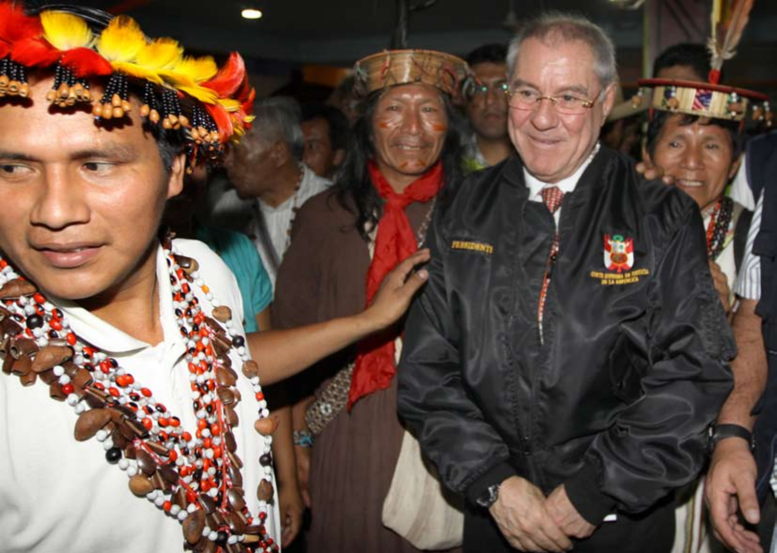
Presidente del Poder Judicial Javier Villa Stein, acompañado por representantes de pueblos amazónicos