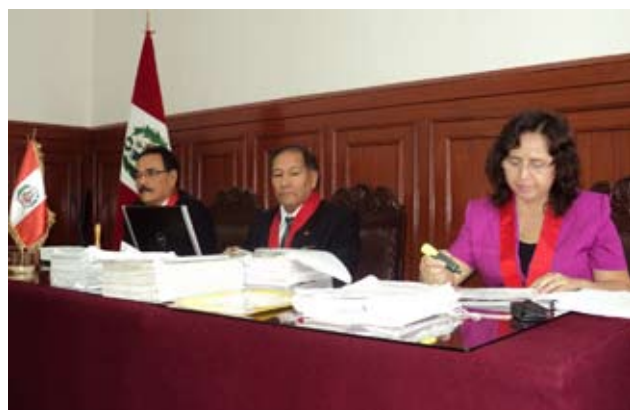
El tribunal que juzgó por video conferencia a un violador