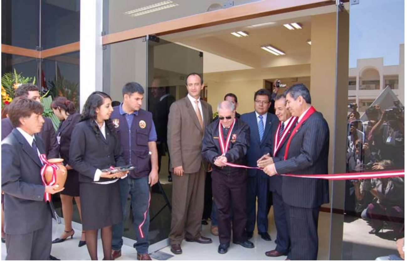
El doctor Javier Villa Stein inauguró moderno edificio en el Distrito Judicial de Arequipa