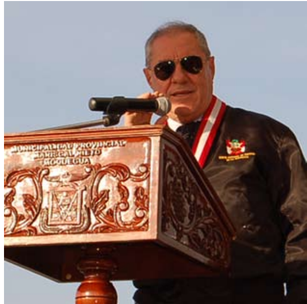
Presidente del Poder Judicial, Javier Villa Stein