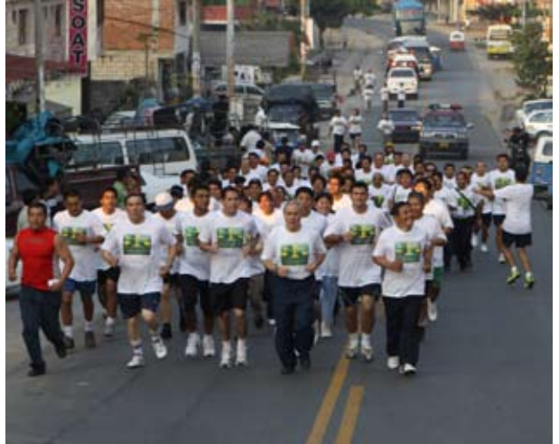
Caminata por calles de la Merced fue un despliegue de unidad judicial y confraternidad

Añadió que "es importante hacer esa recuperación" teniendo en cuenta que existe un antecedente en Australia, donde en 2009, el primer ministro de gobierno reconoció que la cultura hegemónica de su país, oprimió y se enriqueció a costa de los pueblos aborígenes australianos, por lo que pidió disculpas y dispuso "que el Legislativo haga algo para reconocer los derechos usurpados".