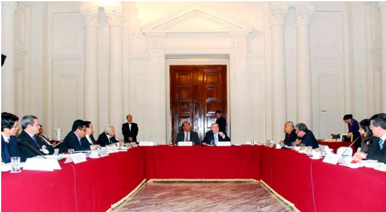
Comisión de Alto Nivel Anticorrupción tomó importantes acuerdos

Por unanimidad, los representantes de las instituciones que forman parte de la Comisión de Alto Nivel Anticorrupción (CAN) que preside el doctor Javier Villa Stein, acordaron el 9 de setiembre solicitar al Presidente del Tribunal Constitucional, Carlos Mesía Ramírez, no suspender su participación en el organismo de lucha contra la corrupción.