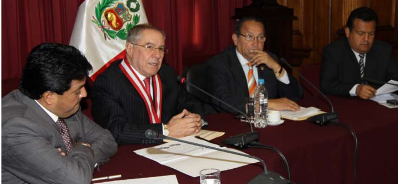
Presupuesto Judicial para el 2011 tiene como meta incrementar el número de expedientes resueltos

Villa Stein expresó preocupación por incumplimiento de ley de consenso