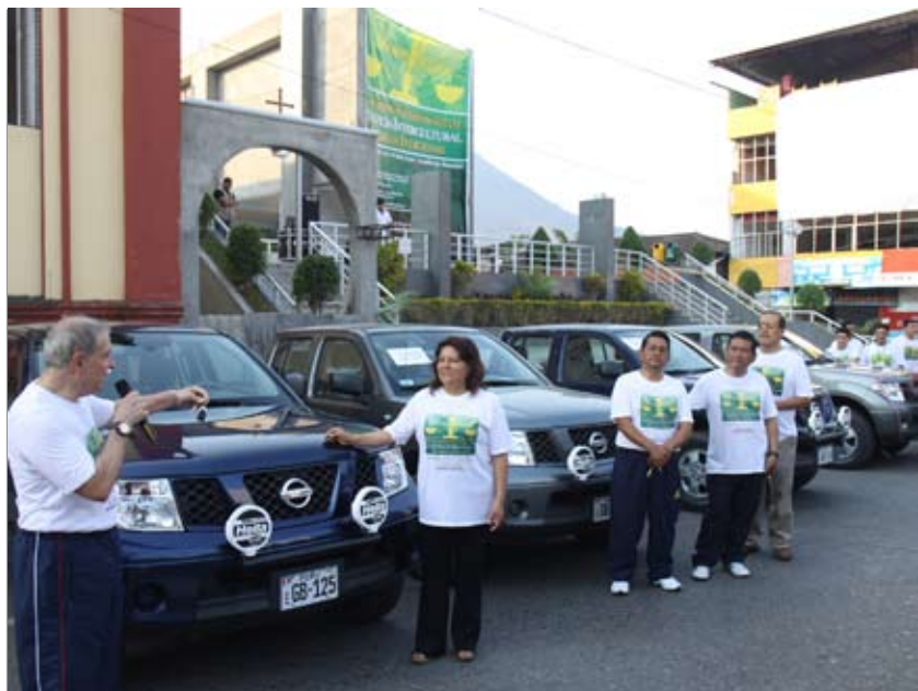
Las Cortes que fueron favorecidas con los modernos vehículos son las de Junín, Huancavelica, Pasco y Huánuco