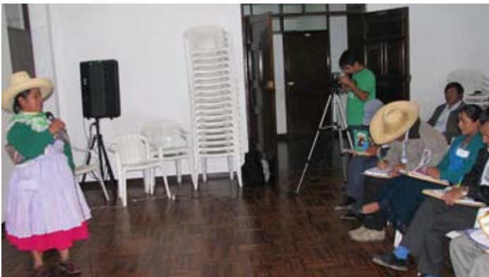
Representantes comunales participan en el taller