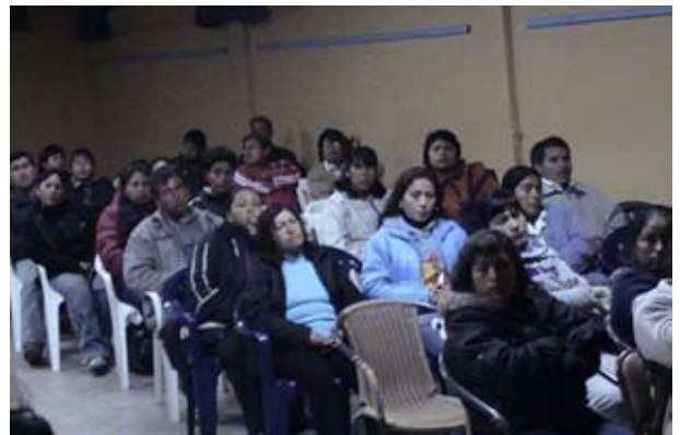
Numerosos padres de familia asistieron a las charlas y talleres

El ciclo forma parte de los actos preparados con motivo del Segundo Festival de Familia donde brindó información y orientación al público acerca de filiación extramatrimonial, alimentos y violencia familiar entre otros.